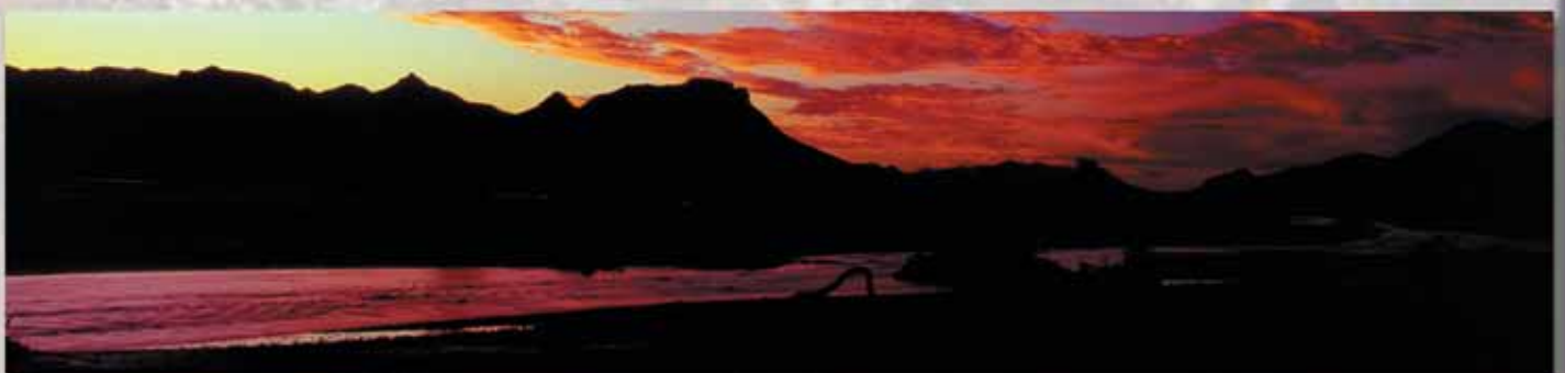
Abendstimmung am Hoarusib Rivier