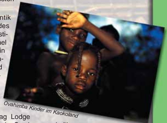
Ovahimba Kinder im Kaokoland

Wüstenelefanten. Lassen Sie sich nach den tollen Erlebnissen in der Palmweg Lodge verwöhnen. Rückkehr nach Swakopmund über Twyfelfontein zu den Felsgravuren und dem "Verbrannten Berg".