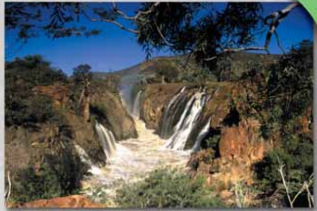
Die Epupa Wasserfälle

Abfahrt von der Palmweg Lodge über Sesfontein zu einigen Ovahimbasielungen und den Epupa- Wasserfällen am mächtigen Kunenefluß. Zwei Zeltübernachtungen am Ufer des Kunene. Tagsüber unternehmen wir kurze Wanderungen in die Umgebung der Epupafälle. Der letzte Tag führt Sie über Fort Sesfontein und Umgebung zurück zur Palmweg Lodge.