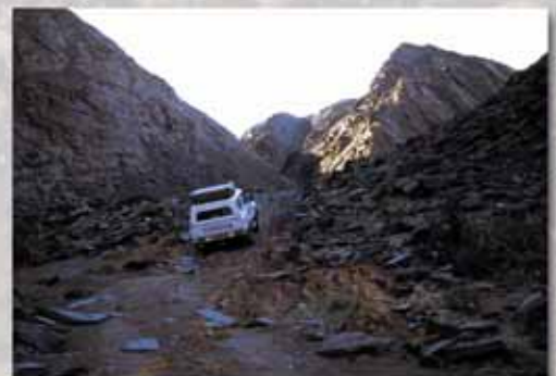
"Kletterpartie" am Ugab Rivier