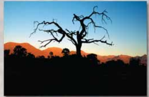
Morgenstimmung im Kaokoland