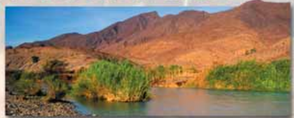
Am Ufer des Kunene

Diese Tour bietet sich als idealer Baustein für eine Selbstfahrrtour an. Erkunden Sie Namibia auf eigene Faust und "verfeinern" Sie Ihren Urlaub mit einer geführten Safari tief in das Kaokoland.