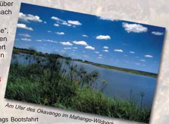
Am Ufer des Okavango im Mahango-Wildpark