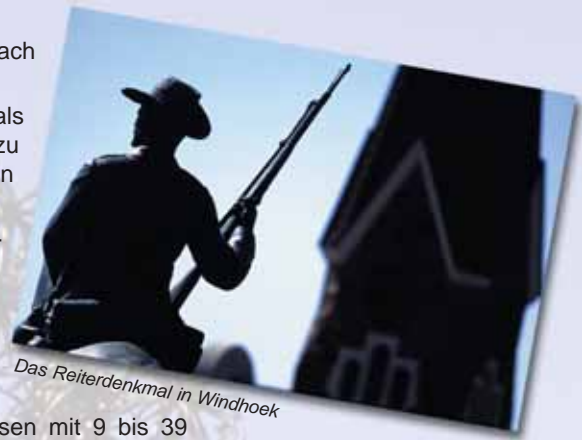
Das Reiterdenkmal in Windhoek