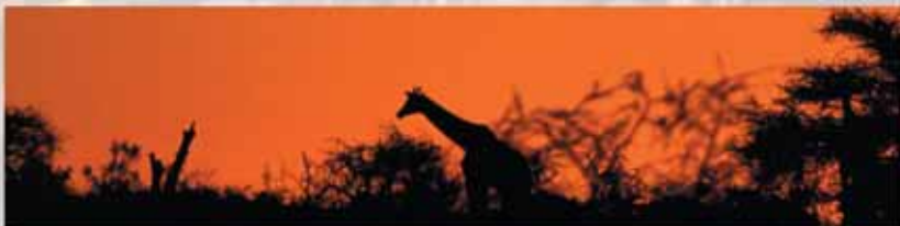
Abendstimmung im Etosha Nationalpark