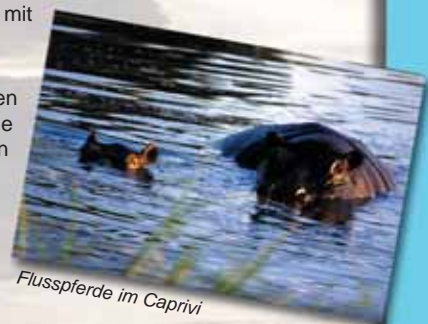
Flusspferde im Caprivi

Tag 15: Rückflug von Victoria Falls zurück nach Eros, Windhoek