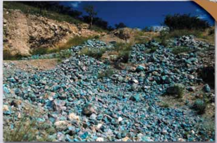
Dioptasmine Omaue im Kaokoland

Da die Tour zu großen Teilen abseits der üblichen, gut ausgebauten Schotterstraßen erfolgt, können die Pistenverhältnisse mitunter sehr schlecht sein. Jeder sollte sich darüber bewusst sein, dass man dementsprechend ziemlich durchgeschüttelt werden kann. Eine einigermaßen gute körperliche Konstitution sollte schon gegeben sein.