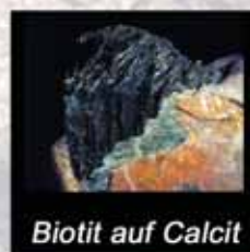
Biotit auf Calcit