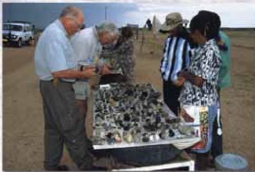
Mineralienkauf an der Spitzkoppe

Die abgebildeten Mineralien können u. a. im Verlauf der Reise gefunden bzw. vor Ort kostengünstig erworben werden. Außerdem noch: viele Pegmatitminerale, Granate, Opale, Prehnit, Rauchquarz, Staurolith, Stilbit, usw. usw..